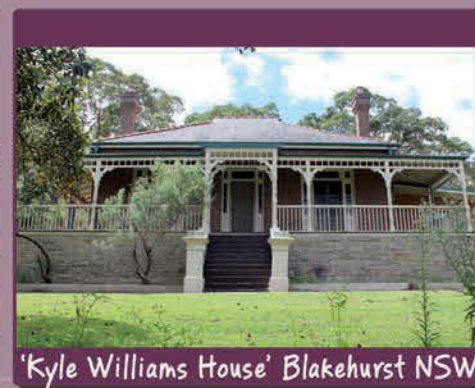
'Kyle Williams House' Blakehurst NSW

Head Office: 5-7 Pearson Street Postal Address: PO Box 17 Gladesville NSW 1675