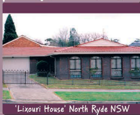
'Lixouri House' North Ryde NSW