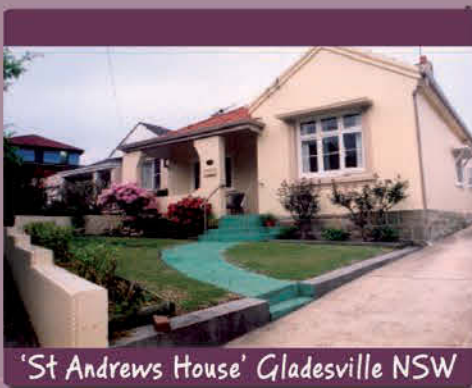
'St Andrews House' Gladesville NSW

Email: admin@estia.org.au | Telephone: (02) 9879 8000