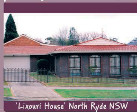
'Lixouri House' North Ryde NSW