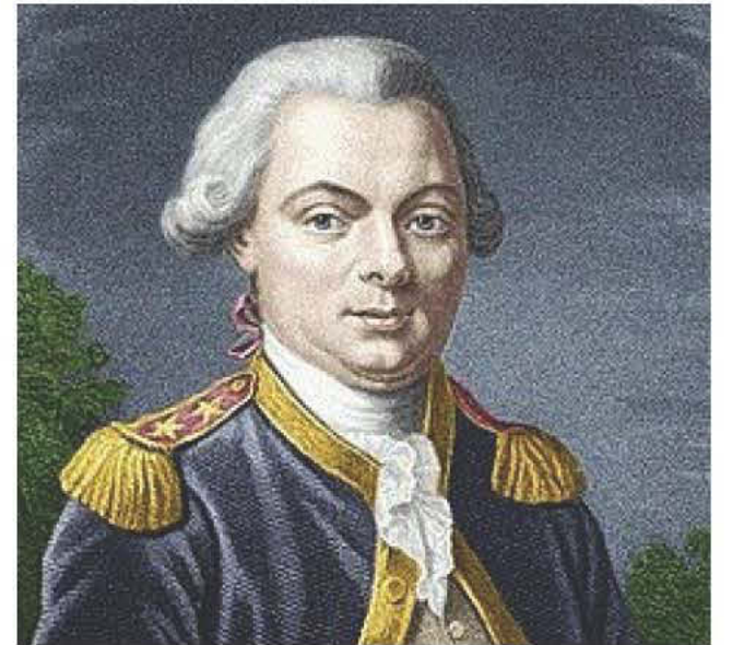
Πορτραίτο του Λαπερούζ

Η προετοιμασία της χρειάστηκε 24 μήνες και συγκέντρωσε περισσότερα τεχνολογικά μέσα από τις προηγούμενες. Είχε δύο πλοία με 52 μέλη πληρώματος και σχεδόν 30 επιστήμονες ερευνητές. Ανεχώρησαν από τη Νουμεά για το Βανίκωρο, αναβιώνοντας έτσι το τελευταίο μέρος του ταξιδιού του Λαπερούζ.