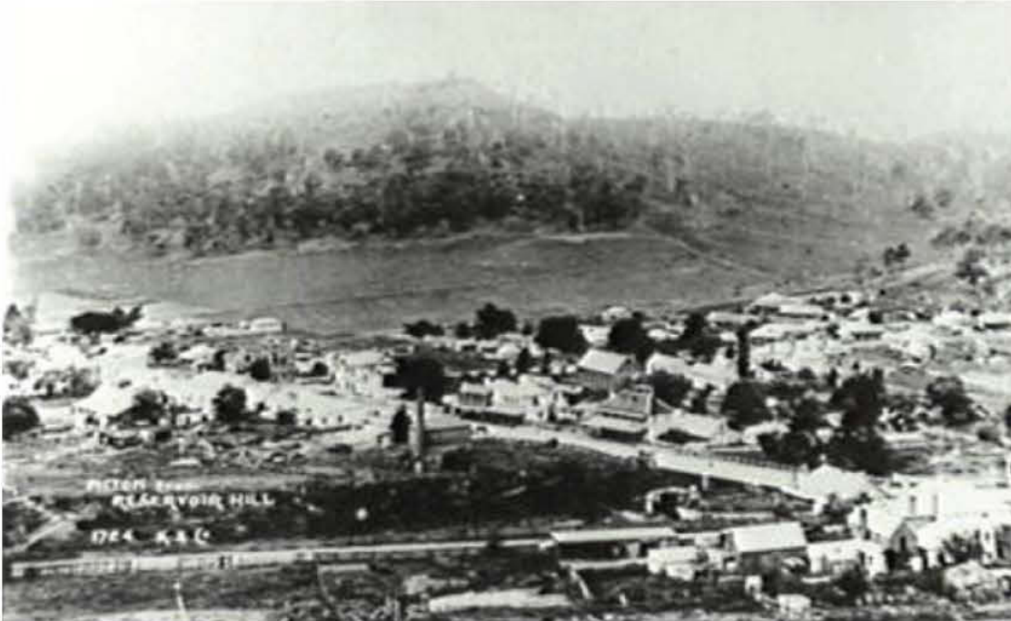
Το χωριό Πίκτον όπως το γνώριζε ο Αντώνης Μανώλης όταν απεβίωσε το 1880.