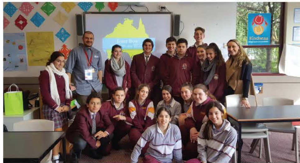
Μαθητές και μαθήτριες από το Σχολείο Oakleigh Grammar.

«Είναι μια από τις πιο δύσκολες γλώσσες στον τεράστιο και λατρεμένο κόσμο μας και νοιώθω υπερήφανος που την ξέρω».