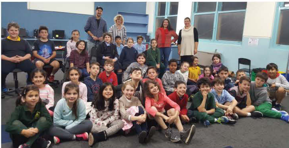
Μαθητές και μαθήτριες απ' το Σχολείο Malvern East της Ελληνικής Κοινότητας Μελβούρνης.