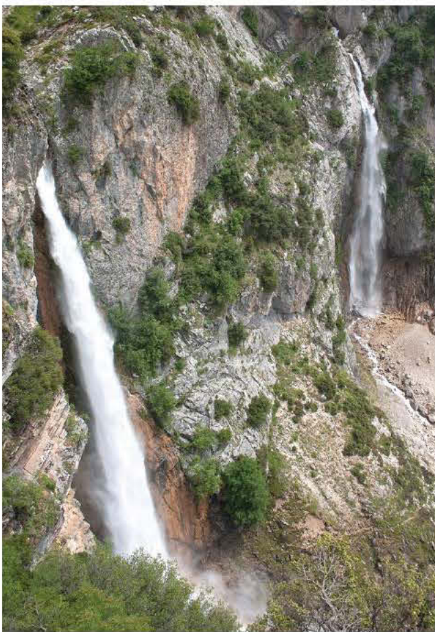
«Καταρράκτης» των Τζουμέρκων

Δημοφιλής και από τους λίγους που μπορεί να φημίζεται για τον αστικό του χαρακτήρα, ο Διπλός καταρ-