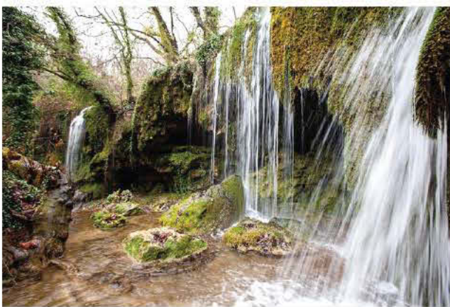
Σκρα του Κιλκίς