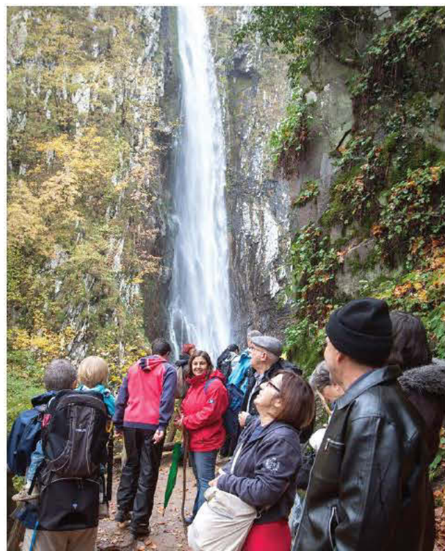
Καταρράκτης του Λειβαδίτη Ξάνθης