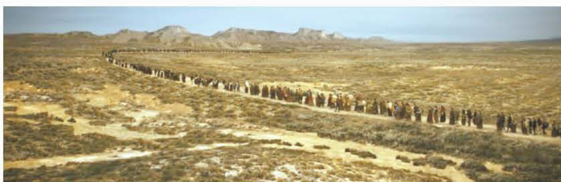
Στιγμιότυπο από την ταινία The Promise , που δείχνει τον εκποτισμό των Αρμενίων της Γισιδίας (κοντά στο Ικόνιο) το 1915.