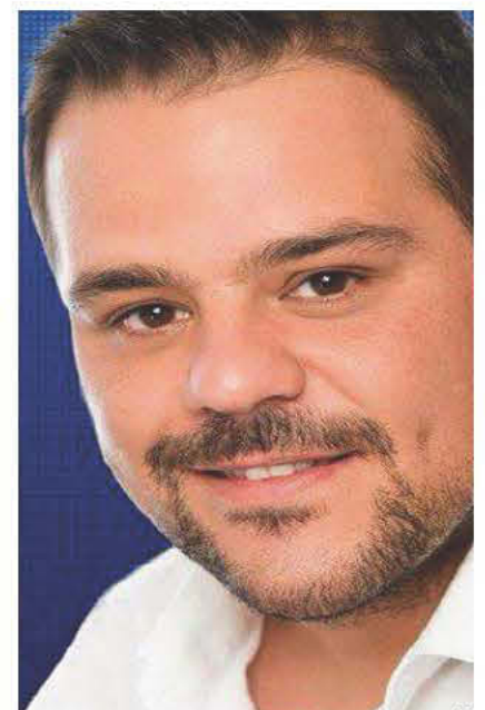
ΑΝΤΙΟ ΣΤΟ ΣΥΔΝΕΪ ΑΠΟ ΤΗΝ ΠΙΣΤΑ ΜΑΣ