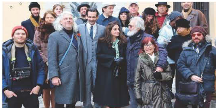
Πολλά από τα γυρίσματα έχουν γίνει στην Κρήτη ΣΤΗ ΦΩΤΟ οι περισσότεροι των συνετελεστών της ταινίας

ΣΤΟΝ ΚΑΖΑΝΤΖΑΚΗ όμως και στην απόφαση να εκφράσω την άποψή μου για μιά από τις πιό "διάσημες" φράσεις (ή απόφθεγμα) του, οδηγήθηκα από το αθηναϊκό ρεπορτάζ που προαναγγέλει