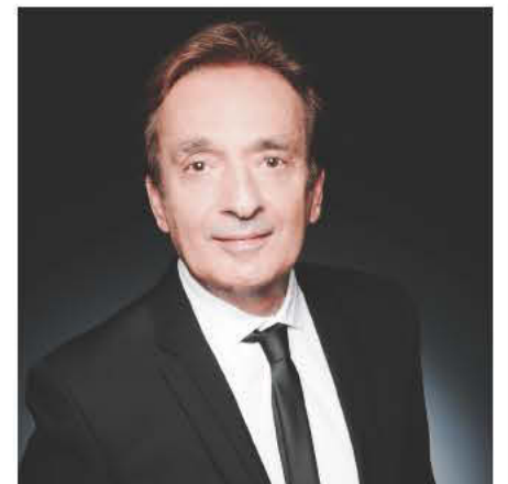
Τάκης Νιρβάνας, η πολυβραβευμένη φωνή της Αυστραλίας