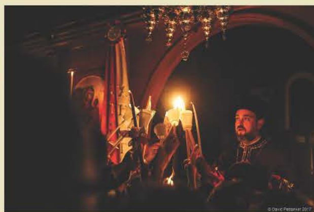
Ο David Petranker φωτογραφίζει την Ανάσταση στον Ιερό Ναό Αγίου Στεφάνου στο Χέρλστον Παρκ