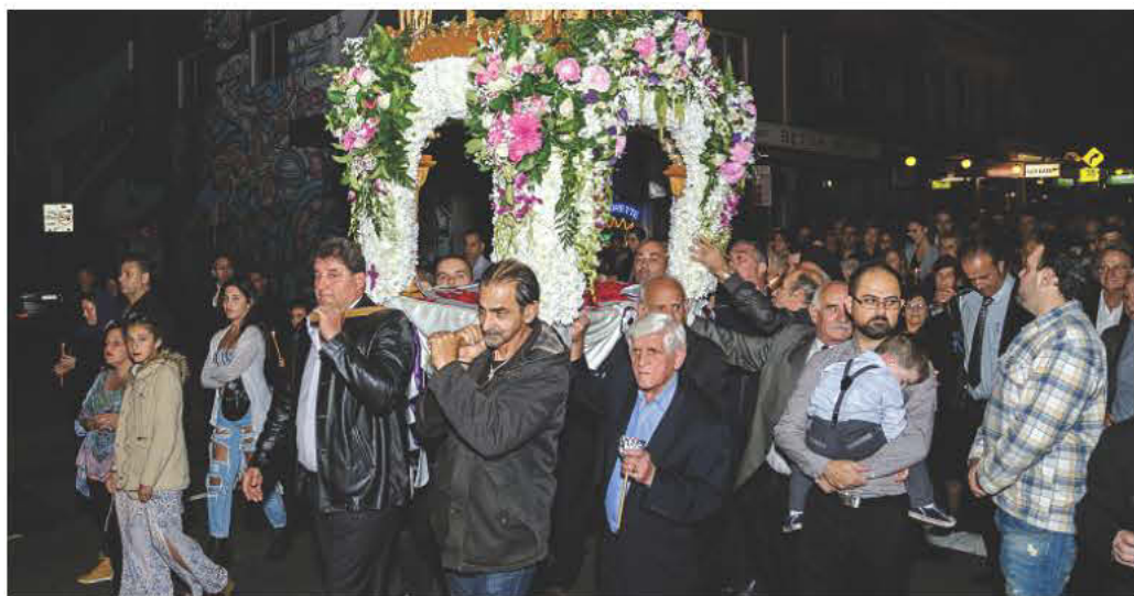
Ο Κωνσταντίνος Τρυφωνόπουλος (Con Tryfon) φωτογραφίζει τον Επιτάφιο στον Ιερό Ναό Αγίου Κωνσταντίνου και Ελένης στο Νιουτάουν.