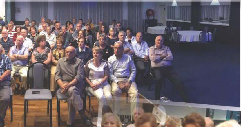
Άποψη της αίθουσας του Παναρκαδικού κατά την διάρκεια της προχθεσινής εκδήλωσης.