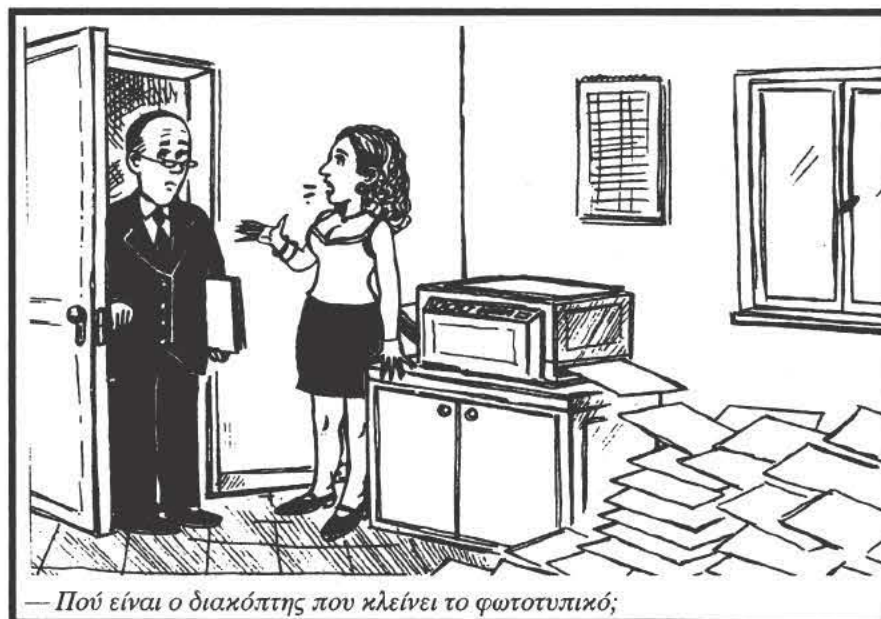
— Πού είναι ο διακόπτης που κλείνει το φωτοτυπικό;