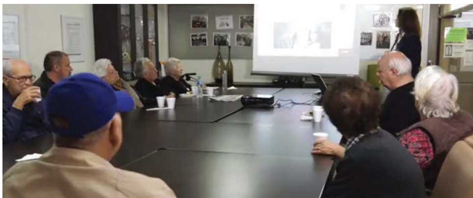
Σεμινάριο με θέμα την Κατάθλιψη

Μ ε αφορμή την εβδομάδα των ανθρώπων της Τρίτης Ηλικίας ή αλλιώς Seniors Week, ο Οργανισμός της Βασιλειάδας οργάνωσε μια σειρά από εκδηλώσεις για τους ενοίκους οι οποίες πραγματοποιήθηκαν στο χώρο του γηριατρείου, καθώς και στο χώρο του Ημερήσιου Κέντρου Φροντίδας του Οργανισμού. Πιο συγκεκριμένα, τη Δευτέρα 6 Μαρτίου και την Τετάρτη 8 Μαρτίου, στο Ημερήσιο Κέντρο Φροντίδας του Οργανισμού, έγινε παρουσίαση σεμιναρίου με θέμα την