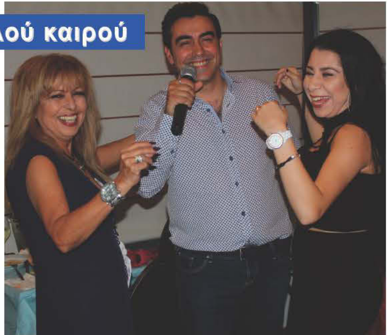
Παρ'όλον ότι ο καιρός ήταν βροχερός οι βραδιές του περασμένου γουηκέντ ήταν, ως συνήθως, με "φουλ χάουζ" στο C-side θυμίζοντας όμορφα γλέντια του παλιού καιρού, στα νυκτερινά μας κέντρα, με καλοφαγάκια και τραγουδια, ζεμιπε-