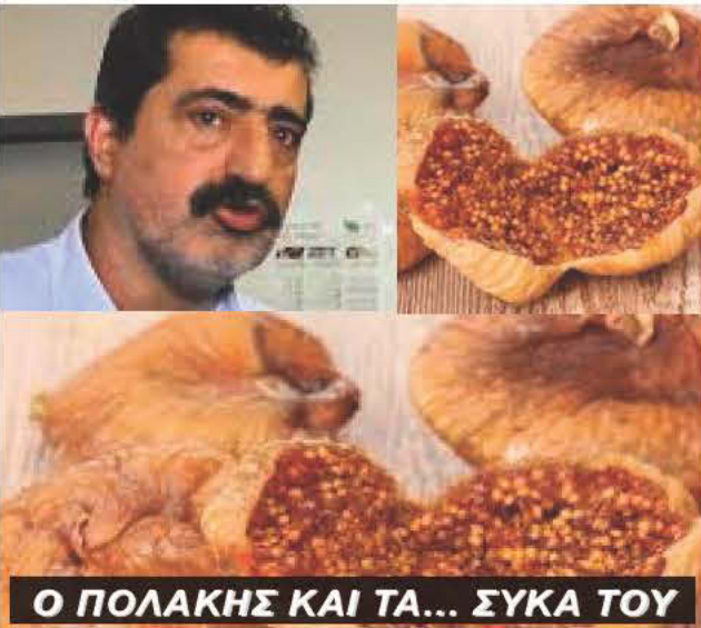
Ο ΠΟΛΑΚΗΣ ΚΑΙ ΤΑ... ΣΥΚΑ ΤΟΥ

ΓΙΑ ΠΡΩΤΗ ΦΟΡΑ , προ ημερών, ο Αυστραλός πρωθυπουργός ξέφυγε από την "καλοκάγαθη" τακτική του και με σφοδρή επίθεση εναντίον τού αρχηγού της Αντιπολίτευσης, αποκάλυψε τον Σόρτεν, παραστικό οργανισμό και κυρίως συκοφάντη. Κατηγορία που εκτός από την ψευτιά αποδίδει, σ' αυτόν που την δέχεται και εγκληματική πρόθεση, αφού σκοπό έχει να λερώσει και να βλάψει αδικώς κάποιο άτομο. Το οποίο συνήθως διαθέτει μια αξιόλογη ιδιότητα.