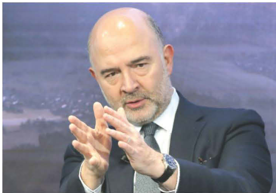
Ο Επίτροπος Οικονομικών Υποθέσεων, Πιερ Μοσκοβισί

πής, η Ελλάδα και η Ευρώπη έχουν συμφωνήσει σε μία «φιλόδοξη» και «αξιόπιστη» ατζέντα μεταρρυθμίσεων, καθώς και σε μία αντίστοιχη δημοσιονομική πορεία κατά τη διάρκεια του προγράμματος και αυτό «αντικατοπτρίζει τις δεσμεύσεις», για την εφαρμογή των οποίων εργάζεται η Ελλάδα.