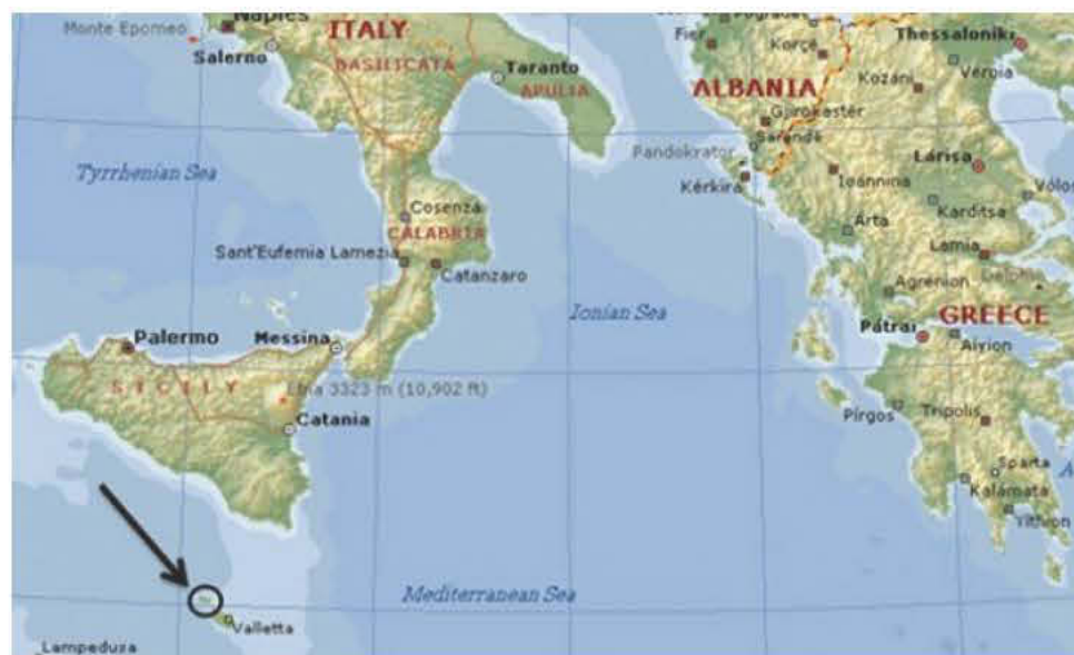
Θέση της Μάλτας στον χάρτη

ανάγκη να χαράξει την πορεία του πλοίου για Μάλτα πήγε στη καμπίνα του με τους χάρτες, όπου πριν από λίγο ο καμαρότος τού είχε σερβίρει τον καφέ. Την ώρα που έπινε τον καφέ του, μετακινήθηκε το φλιτζάνι πάνω στον χάρτη και κάλυψε το σημείο όπου βρίσκεται η Μάλτα. Μάταια λοιπόν έψαχνε ο κυβερνήτης να εντοπίσει το νησί και τελικά απελπισμένος έστειλε τηλεγράφημα στην Τουρκία, λέγοντας «Μάλτα