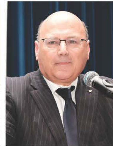
Ο αξιότιμος κ. Arthur Sinodinos που αντιπροσώπευσε τον Πρωθυπουργό της Αυστραλίας κ. Malcolm Turnbull