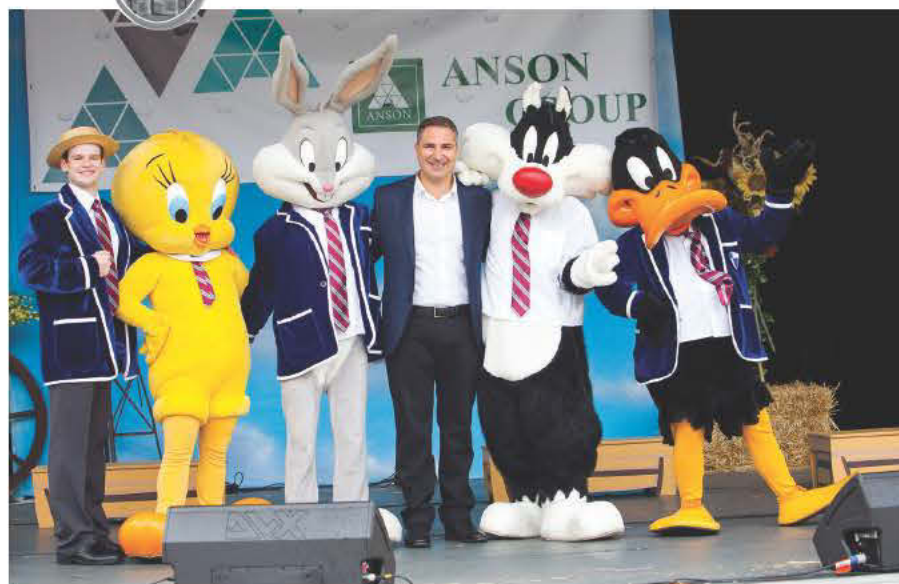
Ελάτε να γιορτάσουμε τον ερχομό της Άνοιξης

Burwood Council heritage • progress • pride