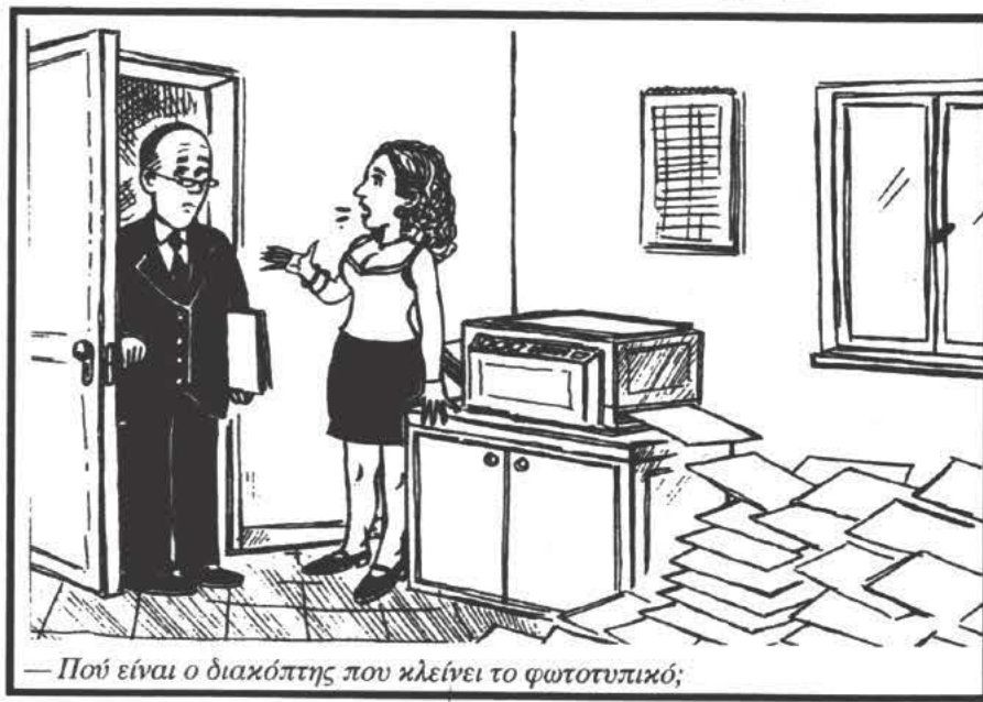
— Πού είναι ο διακόπτης που κλείνει το φωτοτυπικό;