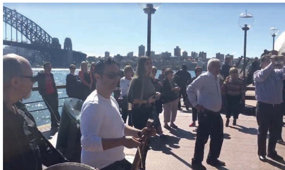
Ο Πόντιος ζει ... δίπλα στην περίφημη Όπερα του Σίδνεϊ.

Αριστεία Κομνηνός για στήριξη της Ομοσπονδίας: Ελληνικός Ποντιακός Σύλλογος Wollongong «Διογένης», Ποντιακή Λέσχη Καμπέρρας , Ποντιακή Αδελφότητα Νέας Νοτίου Ουαλίας «Ποντοξενιτέας», Ποντιακή Αδελφότητα Νοτίου Αυστραλίας και Ποντιακό Ίδρυμα Αυστραλίας και Νέας Ζηλανδίας «Παναγία Σουμελά»