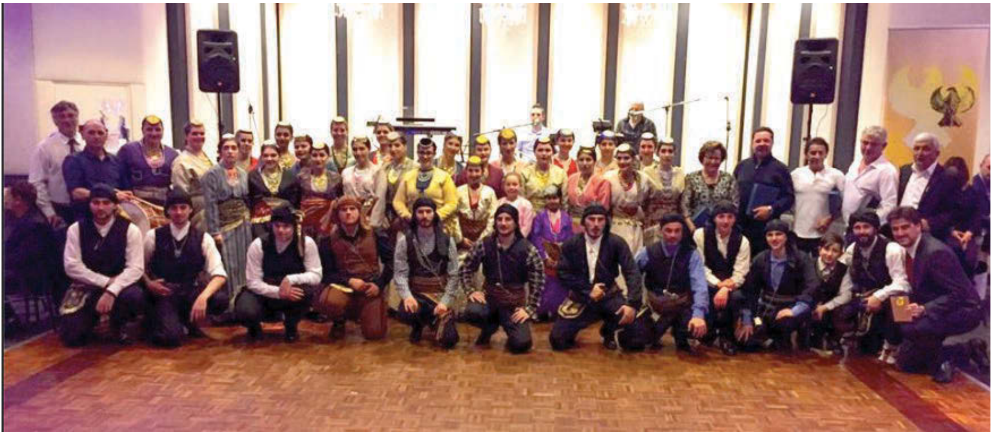
Οι χορευτές μαζί με τους βραβευθέντες