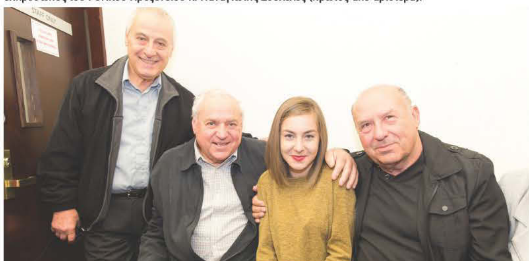
Οι οικογενειακοί που βρέθηκαν στο Δημαρχείο γνωρίστηκαν με τα παιδιά από το Καστελλόριζο και έβγαλαν μαζί τους αναμνηστικές φωτογραφίες.