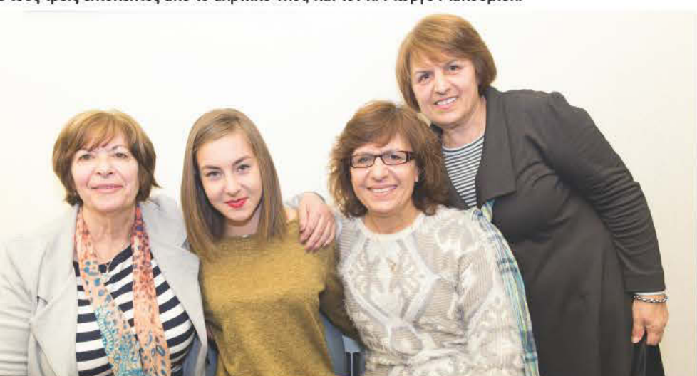
Οι οικογενειακοί που βρέθηκαν στο Δημαρχείο γνωρίστηκαν με τα παιδιά από το Καστελλόριζο και έβγαλαν μαζί τους αναμνηστικές φωτογραφίες.