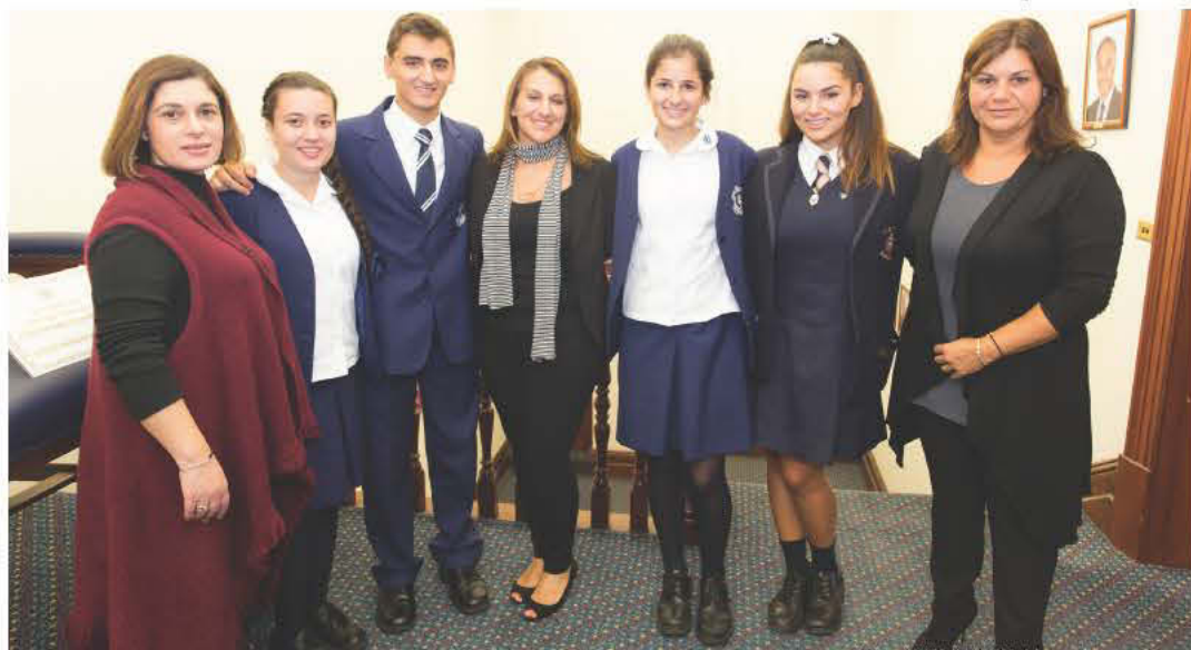
Μαθητές του Κολλεγίου του Αγίου Σπυρίδωνα με καταγωγή από το Καστελλόριζο και οι μητέρες τους υποδέχτηκαν τους μαθητές από το Καστελλόριζο.