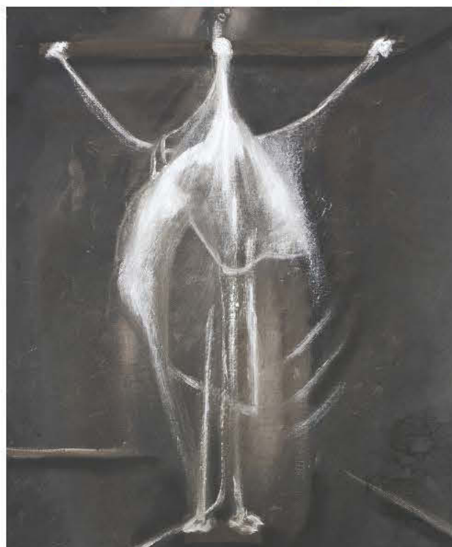
Francis Bacon και Alonso Cano, Σταύρωση, 1933 και 1638

ρίβλεπον ευωχίαν τοις βασιλεύσιν ημών προεξένησεν».