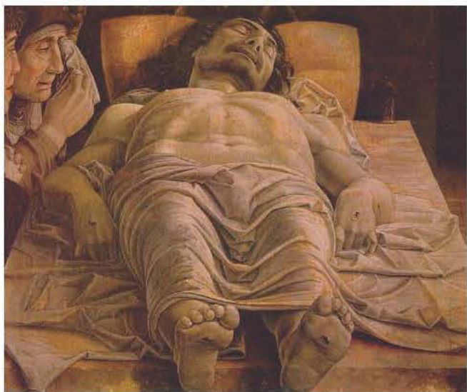
Μαντένια, «Ο θρήνος για το νεκρό Χριστό», 1490

66ου κανόνος της θέσπισε «Από της αγίας Αναστασίμου Χριστού του Θεού ημών ημέρας μέχρι της Καινής Κυριακής την όλην Εβδομάδα εν ταις αγίαις εκκλησίαις σχολάζειν δει απαραιλείτως τους πιστούς. Μπδαμώς ουν εν ταις προκειμέναις ημέραις ιπποδρόμια ή ετέρα δημώδης θέα επιτελείσθω».