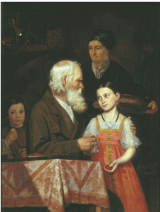
Νικηφόρος Λύτρας, Το ωόν του Πάσχα