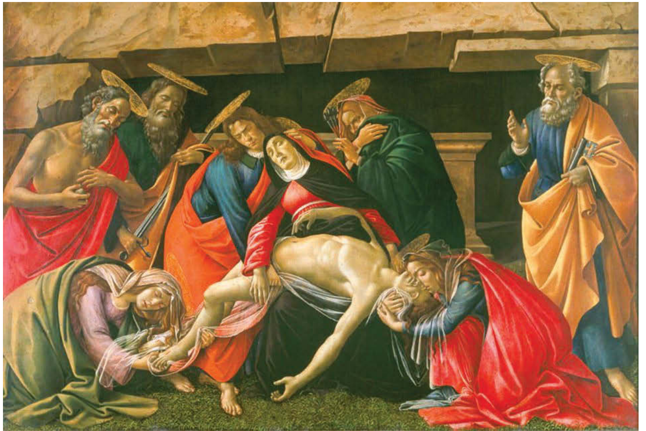
S. Botticelli, Επιτάφιος θρήνος του Χριστού. Περίπου 1490. Παλαιά Πινακοθήκη-Μόναχο (Alte Pinakothek)

Χριστιανοί κατά τις ημέρες του Πάσχα, αλλά και καινούργια φορέματα φρόντιζαν να φορέσουν, να λαμπροφορέσουν, όπως έλεγαν τότε, ή, όπως λέμε σήμερα, να φορούν Πασχαλιάτικα, Λαμπριάτικα ή λαμπρά ή να λαμπραγκαινιάζουν.