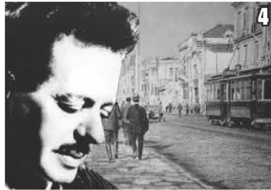
Φωτο -1: Ο Βασίλης Τσιτσάνης πήρε το ρεμπέτικο από τα καπηλειά και το περιθώριο και το πέρασε στα σαλόνια. Φωτο-2: Εξώφυλλο από τους πρώτους δίσκους του τραγουδιού «Συννεφιασμένη Κυριακή». Φωτο-3: Συννεφιασμένη μέρα να πέφτει και Κυριακή «Σου ματώνει την καρδιά». Φωτο-4: Φωτογραφία του Τσιτσάνη με φόντο την Αθήνα την παλιά. Φωτο-5: Χειρόγραφο του Τσιτσάνη με την υπογραφή του όταν έγραψε την «Συννεφιασμένη Κυριακή». Φωτο-6: Εμπλούτισε την λαϊκή ορχήστρα προσθέτοντας το πιάνο και επέβαλε το ακορντεόν.

5 Συννεφιασμένη Κυριακή μοιάζει με την καρδιά μου που έχει πάντα συννεφιά Χριστέ και Παναγιά μου Είσαι μια μέρα σαν κι αυτή που 'χασα την χαρά μου που έχει πάντα συννεφιά Χριστέ και Παναγιά μου μοιάζει με την καρδιά μου που έχει πάντα συννεφιά Χριστέ και Παναγιά μου