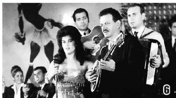
Φωτο -1: Φωτογραφία από εξώφυλλο δίσκου με τον Βασίλη Τσιτσάνη και την Μαρίκα Νίνου.