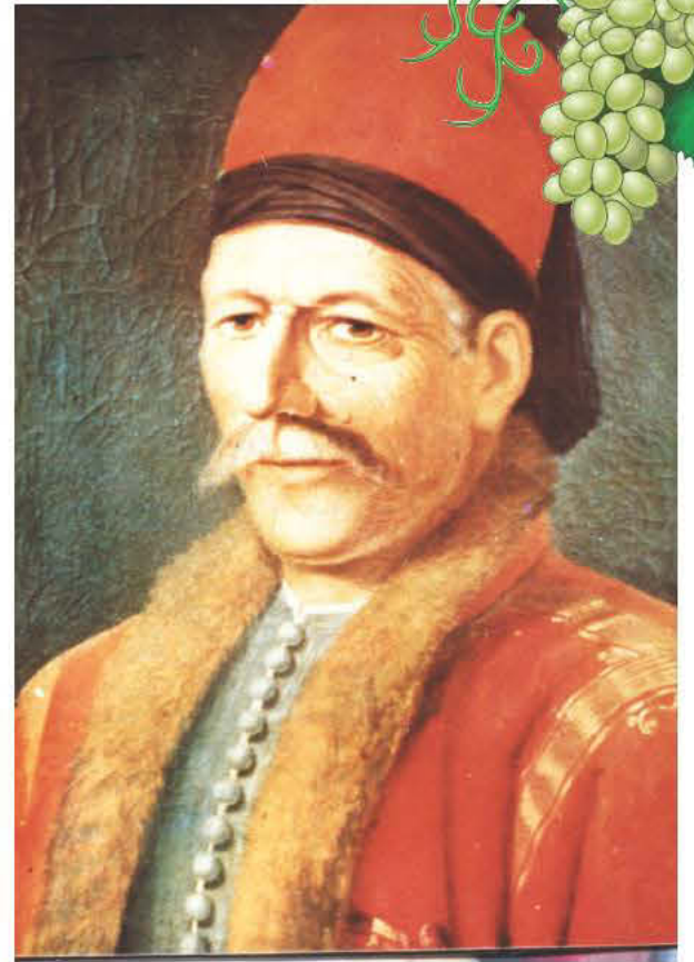
Λυκούργος Λογοθέτης: Πολιτικός και στρατιωτικός αρχηγός της Σαμιακής επανάστασης το 1821.