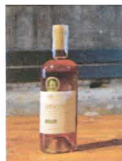
Η γη του οίνου