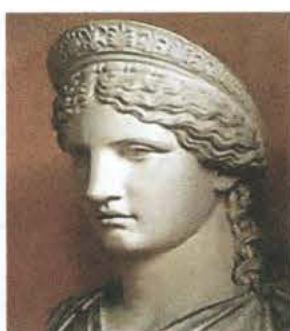
Η κατοικία της Θεάς Ηρας