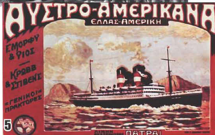
Φωτο-1: Ρίτα Αμπατζή, η προσφυγοπούλα από την Σμύρνη που μάγεψε με την φωνή της. Φωτο-2: Προσφυγοπούλα το 1922 περιμένουν σειρά, για διανομή φαγητού. Φωτο-3: Νεαρές μετανάστριες στοιβαγμένες στο πλοίο για την Αμερική. Γι' αυτές γράφτηκε και το τραγούδι «Μη με στέλνεις μάνα στην Αμερική». Φωτο-4: Η Ρίτα Αμπατζή με την αδελφή της στο πλοίο για περιοδεία στην Αλεξάνδρεια. Φωτο-5: Αφίσα της εποχής που διαφήμιζε τις ακτοπλοϊκές γραμμές για Αμερική και Αυστραλία. Φωτο-6: Εξώφυλλο από δίσκο της Ρίτα Αμπατζή που γράφει: «Οι μούσες του «καφέ αμάν»».