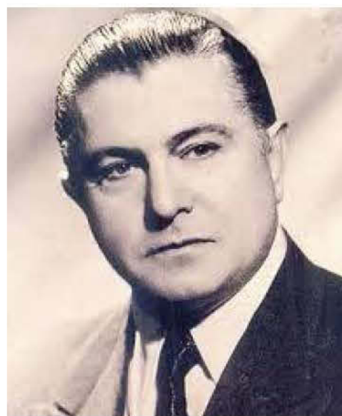
Ο τενόρος Πέτρος Επιτροπάκης

εκείνη με τις συνεχείς συγκρούσεις των Βενιζελικών και των Βασιλικών, ήταν ήδη ένα πφαισείο έτοιμο να εκραγεί. Η έκρηξη θα γίνει λίγα χρόνια αργότερα για να σκορπίσει και να κάψει με την λάβα του, την ταλαίπωρη πατρίδα, και να ζήσει ο λαός μας, τις τραγικές συνέπειες της δικτατορίας του Ιωάννη Μεταξά.