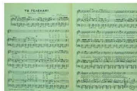
Το «Γιλεκάκι» παρτιτούρα

«Το γιλεκάκι» σαν λαϊκό άσμα δεν είχε τίποτε το πολιτικό σημάδι ή μήνυμα. Ορισμένοι υποστηρίζουν ότι έφερνε «κάποιους καημούς της Σμύρνης». Όποιο και αν ήταν το κίνητρο του σιττουργού και σε προέκταση του συνθέτη το τραγούδι αυτό, ήταν «μια ευτυχής στιγμή», που σφράγισε την εποχή του. Εξάλλου το γιλέκο την εποχή εκείνη ήταν κάτι πολύ χαρακτηριστικό στην ανδρική εμφάνιση.