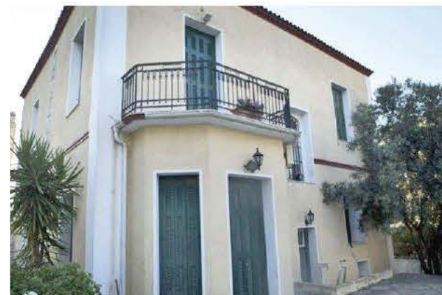
Αριστερά: Ο Γιώργος Δροσίνης «Νέος, όμορφος, καλλιεργημένος ήταν τέλειος δανδής», έγραφαν οι χρονογράφοι της εποχής του. Ήταν τότε που εμπνεύστηκε την «Ανθισμένη Αμυγδαλιά». Μεσαία: Η Αθήνα και οι Αθηναίες την εποχή που γράφτηκε το ποίημα και έγινε τραγούδι. Το τραγουδούσαν οι κανταδόροι κάτω από τα μαπακόνια τους. Δεξιά: Η έπαυλη του ποιητή. Ο Γιώργος Δροσίνης την ονόμασε «Αμαρυλλίς».