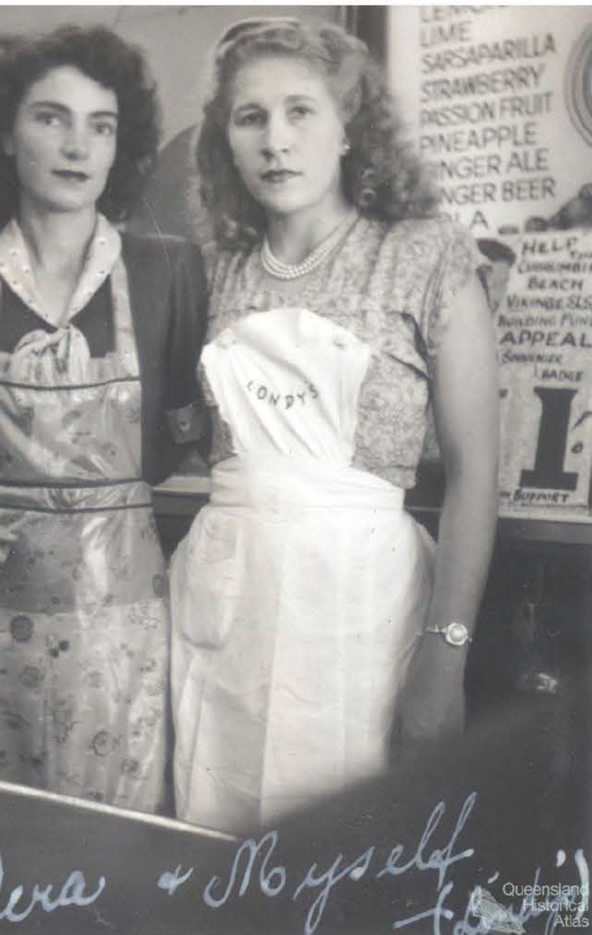
... + Moysel Queensland Historical Atlas