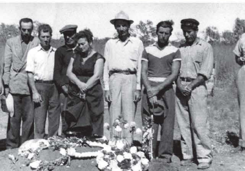
παρρηγορητών στο Μπρουμ.