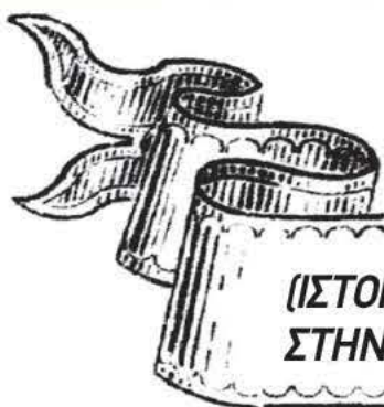
(ΙΣΤΟΡΙΚΕΣ ΦΩΤΟΓΡΑΦΙΕΣ ΑΠΟ ΤΑ ΘΕΟΦΑΝΕΙΑ ΣΤΗΝ ΕΛΛΑΔΑ)