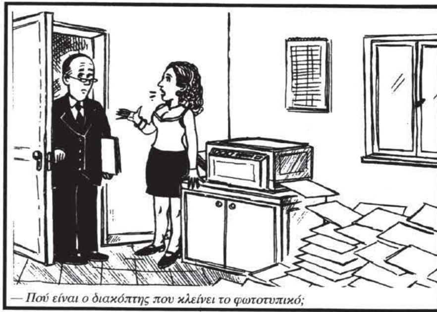
— Πού είναι ο διακόπτης που κλείνει το φωτοτυπικό;