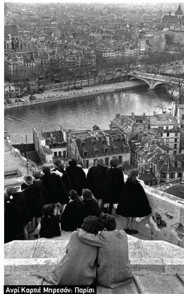
Ανρί Καρπέ Μπρεσόν. Παρίσι