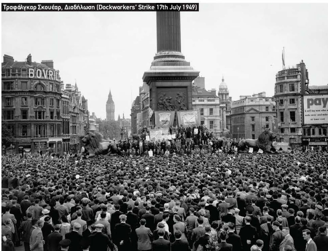
Τραφάλγκαρ Σκουέαρ, Διαδήλωση (Dockworkers' Strike 17th July 1949)