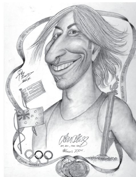
Ο Τόνι έκανε και το σκίτσο του μεγάλου Αυστραλού Ολυμπιονίκη Ιαν Θορν, στους Ολυμπιακούς της Αθήνας.