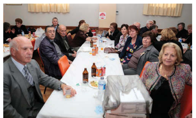
Πολλοί ήταν οι συμπάριοι που έσπευσαν να στηρίξουν την προσπάθεια της ΟΕΕΓΑ και να συμβάλουν οικονομικά στην ενίσχυση της έρευνας για τη θεραπεία του παιδικού καρκίνου