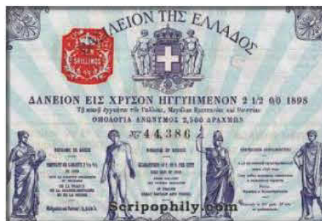
Ομόλογο ελληνικού δημοσίου του 1898

Με τα ελάχιστα δημόσια έσοδα της από την φορολόγηση της αγροτικής παραγωγής, η Ελλάδα εξυπηρέτησε το δάνειο αυτό κακώς μέχρι τον Μάιο του 1843, οπότε ο Όθων ανέστειλε οριστικά τις πληρωμές τόκων και χρεολυσίων. Η Ελλάδα θα βρεθεί εκτός αγορών για τριανταπέντε