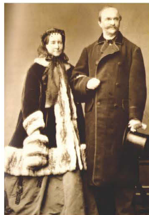
Όθωνας και Αμαλία

Το τέταρτο εξωτερικό δάνειο συνάφθηκε το 1879, οπότε και η Ελλάδα ήρθε σε συμβιβασμό με τους δανειστές της, παλαιούς και νέους, αφού ο καγκελάριος Βίσμαρκ απείλησε να μπλοκάρει την συνθήκη προσαρτήσεως της Θεσσαλίας αν δεν εξοφλούντο άμεσα οι Βαυαροί κληρονόμοι. Ο οδυ-