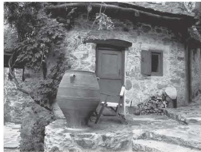
Οικισμός Μηλιά Χανίων

Η αρχιτεκτονική της περιοχής είναι η παραδοσιακή αρχιτεκτονική της νοτιοανατολικής Κρήτης. Τα πετρόχιστα σπιτάκια δένουν αρμονικά με το τοπίο μεταφέροντας τον επισκέπτη σε μιά άλλη εποχή και κατάσταση. Χτίστηκαν πριν από περίπου 300