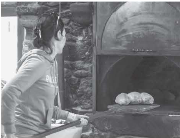
Παραδοσιακός φούρνος στην Μηλιά Χανίων

Για την ιστορία, η αναγέννηση της Μηλιάς ήταν ένα όνειρο δύο νέων ανθρώπων με ένα διαφορετικό όραμα, οι οποίοι έβλεπαν ένα οικολογικό χωριό γεμάτο ζωή εκεί που οι άλλοι έβλεπαν χαλάσματα. Ζεστά, παραδοσιακά σπιτάκια, να βλέπεις τις καμινάδες τους να ανηρίζουν (κάποια έχουν ξυλόσομπες και κάποια άλλα τζάκι) και να σου έρχεται να πάρεις πινέλο και χαρτί και να αρχίζεις να τα αποτυπώνεις ακόμα και αν δεν ξέρεις τίποτα από ζωγραφική. Πόσο τυχερός στάθηκα την δεύτερη φορά όταν αποφάσισα