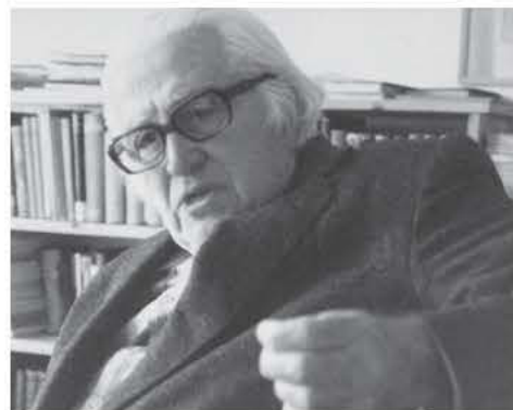
Νίκος Γαβριήλ Πεντζίκης

Να πλησιάζεις στις παλιές αποθήκες του λιμανιού, μουσεία και αίθουσες προβολών τώρα, μέσα στον υγρό χειμώνα της πόλης. Να περπατάς ανάμεσά τους χωρίς τη βαβούρα του καλοκαιριού, χωρίς την πολυκοσμία των φεστιβάλ, των γάμων, των προεκλογικών συγκεντρώσεων. Να περπατάς και να ρεμβάζεις μέσα στο καταχείμωνο, καθώς ο αγέρας φυσάει... Να ταξιδεύει ο νους σου στα περασμένα μεγαλεία της πόλης.