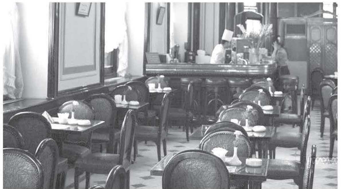
Το ξακουστό κέντρο «Τρίανο» στην Αλεξάνδρεια. Εκεί τα παλιά χρόνια σύχναζε η αριστοκρατία της εποχής.