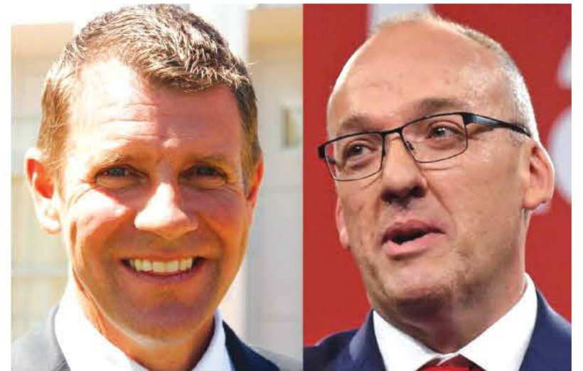
Ο πρόεδρος της ΝΝΟ Μάλκ Μπέρντ (αριστερά) και ο επικεφαλής της αντιπολίτευσης Λουκ Φόλι (δεξιά)

Εύκολη λύση χαρακτήρισε ο ηγέτης της αντιπολίτευσης Λουκ Φόλι την πρόταση του Πρέμιερ να αυξήσει το φόρο αγαθών και υπηρεσιών (GST) έως 15 τοις εκατό αλλά δεν φαίνεται να έχει διαβάσει ο ίδιος όλες τις λεπτομέρειες της πρότασης του κ. Baird. Ο Πρέμιερ ανέφερε ότι η αύξηση του ποσοστού του GST, από 10 σε 15 τοις εκατό, θα γίνει για να καλυφθεί το αυξανόμενο κόστος της υγειονομικής περίθαλψης.