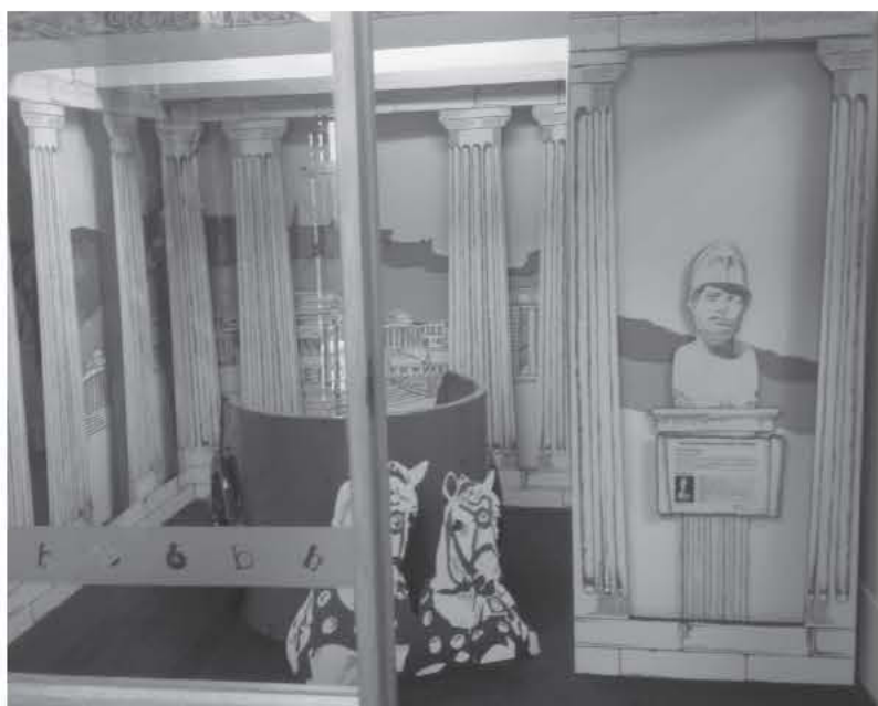
Χώρος εντός του μουσείου όπου οι μικροί πολίτες μπορούν να ντυθούν με "αρχαίες" στολές και να παίξουν στην "αρχαία Αθήνα" του Περικλή.

Μ ε αφορμή τις εξελίξεις στην πατρίδα, η σημερινή σελίδα της ΑΧΕΠΑ παρουσιάζει φωτογραφίες από το Μουσείο Αυστραλιανής Δημοκρατίας στην Καμπέρρα, το άλλοτε παλαιό Ομοσπονδιακό Κοινοβούλιο. Το μουσείο αυτό - σε διάφορα σημεία - παρουσιάζει εκθέματα και αναφορές στον πολιτισμό των Ελλήνων. Μέχρι και οι τάπητες έχουν τον μαϊνάνδρο στις άκρες τους.