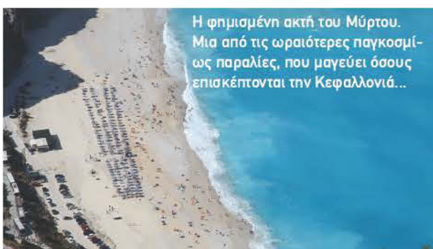
Η φημισμένη ακτή του Μύρτου. Μια από τις ωραιότερες παγκοσμίως παραλίες, που μαγεύει όσους επισκέπτονται την Κεφαλλονιά...

Βάζω σ' αυτές τις λίγες γραμμές τη συγκίνηση, τα αισθήματα και τους συμβολισμούς που μου έδωσε αυτό το ντοκιμαντέρ και προσπαθώ, έτσι πρόχειρα, να τις πω όσο μπορώ πιο λογικά. Και πρώτα το ξεκίνημά του με τις εικόνες του Σίδνεϊ, που χρόνια τώρα με συνδέουν δεσμοί φιλίας, αλλά και κοινών σκοπών με εκλεκτά μέλη της ελληνικής παροικίας και βέβαια την τιμή που μου κάνουν να δημοσιεύουν άρθρα μου στην εφημερίδα «Ο ΚΟΣΜΟΣ».