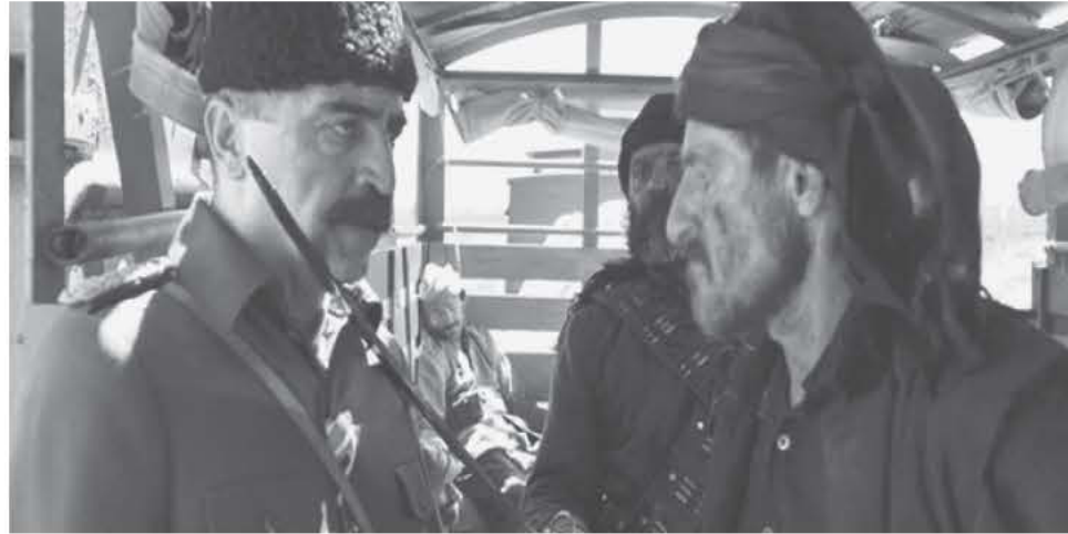
Σκηνή από την ταινία. Ο καλός τούρκος και ο κακός Έλληνας

Πριν από μερικές μέρες η ταινία προβλήθηκε και από την αυστραλιανή τηλεόραση σε ώρα prime time, σε ζώνη δηλαδή υψηλής τηλεθέασης. Αλλά ας δούμε μερικά από τα στιγμιότυπα. Το σκηνικό του ντεμπούτου του Ράσελ Κρόου χαρακτηρίζεται από ανθελληνικές αναφορές, την ώρα μάλιστα που παρουσιάζει τους Τούρκους ως αθώα