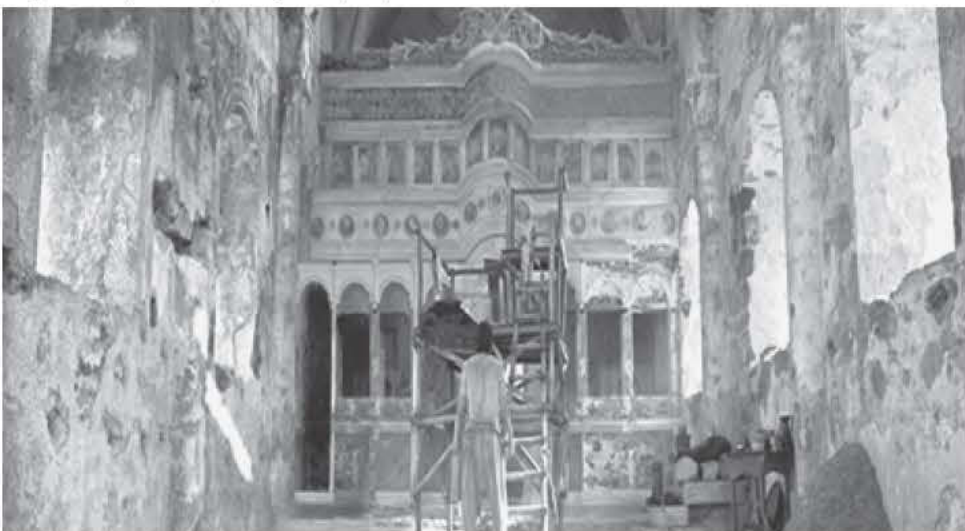
Η εκκλησία στο εγκαταλελειμμένο χωριό Λιβίσι