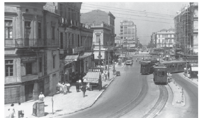
Αθήνα 1950-55 με τραμ. Η οδός Πανεπιστημίου και η Πλατεία Ομονοίας.