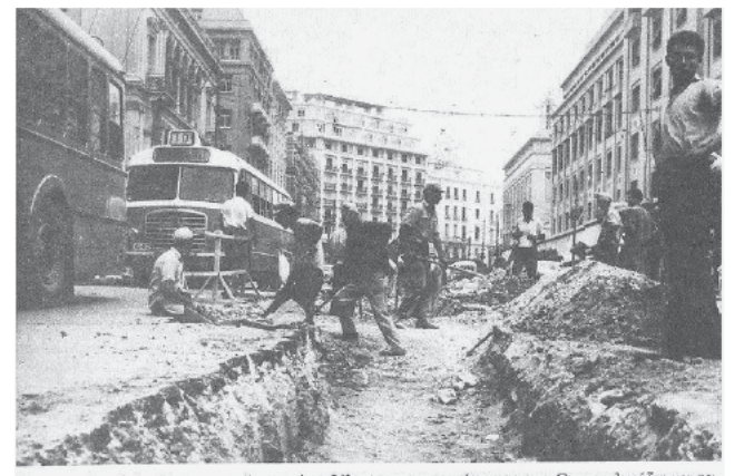
Έργα στη Λεωφόρο Πανεπιστημίου μετά το ξήλωμα της γραμμής του τραμ. Οι μπουλντόζες και τα εκκαπτικά μηχανήματα δεν έχουν ακόμα εμφανισθεί στην Αθήνα.