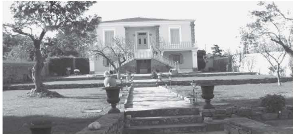
Το στρατηγείο του Τσώρτσιλ όπως είναι σήμερα στο χωριό Πορτιανού Λήμνου

Η αποχώρηση των δυνάμεων της ANZAC από την Καλλιόλη άρχισε στις 19 Δεκεμβρίου του 1915. Τα αίτια της αποτυχίας αυτής ήταν η έλλειψη ικανοτήτων των ανώτερων στρατιωτικών διοικητών και ιδιαίτερα των Συμμαχικών δυνάμεων. Ωστόσο οι άνδρες της ANZAC πολέμησαν ηρωικά και με σθένος. Υπήρξαν μεγάλες απώλειες και από τις δύο πλευρές, όμως περισσότερες ήταν αυτές των Συμμάχων και των Αυστραλονεοζηλανδών. Η εκστρατεία αποδείχθηκε το μεγαλύτερο φιάσκο των Άγγλων και πιο ειδικά του Ουίλσον Τσώρτσιλ, που ως