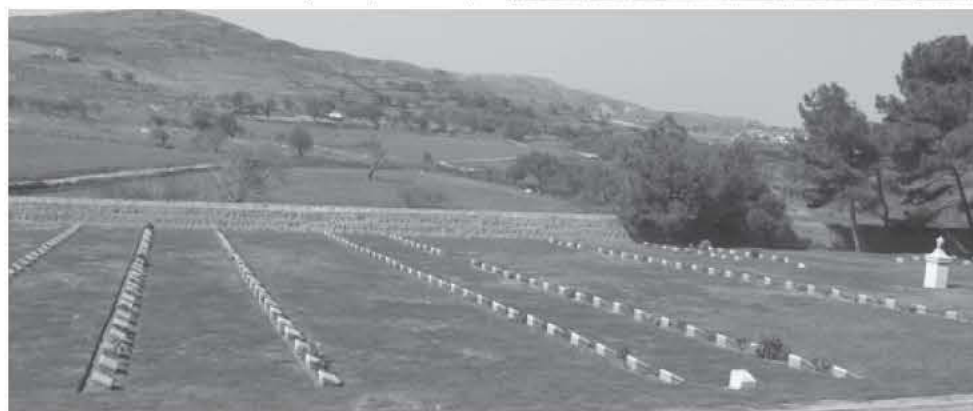
Το συμμαχικό νεκροταφείο στο Πορτιανού

νεκρών στρατιωτών ήρθαν έτοιμα από την Ιταλία. Τα δέντρα φυτεύτηκαν το 1927 περίπου από το Χρήστο Ιλερή, πατέρα του Δημήτρη Ιλερή, που ήταν υπεύθυνος μέχρι το 1946 για τα τρία νεκροταφεία: Μούδρου, Πορτιανού και Αράπικα ή Αραβικά.