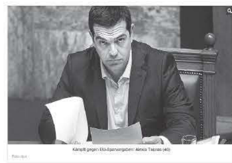
Karzell gegen EU-Überwachungs: Alexis Tsipras (40)